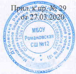
График дежурства администрации и сторожей